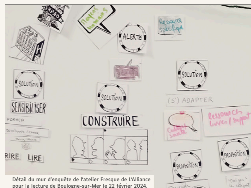
Détail du mur d'enquête de l'atelier Fresque de L'Alliance pour la lecture de Boulogne-sur-Mer le 22 février 2024.